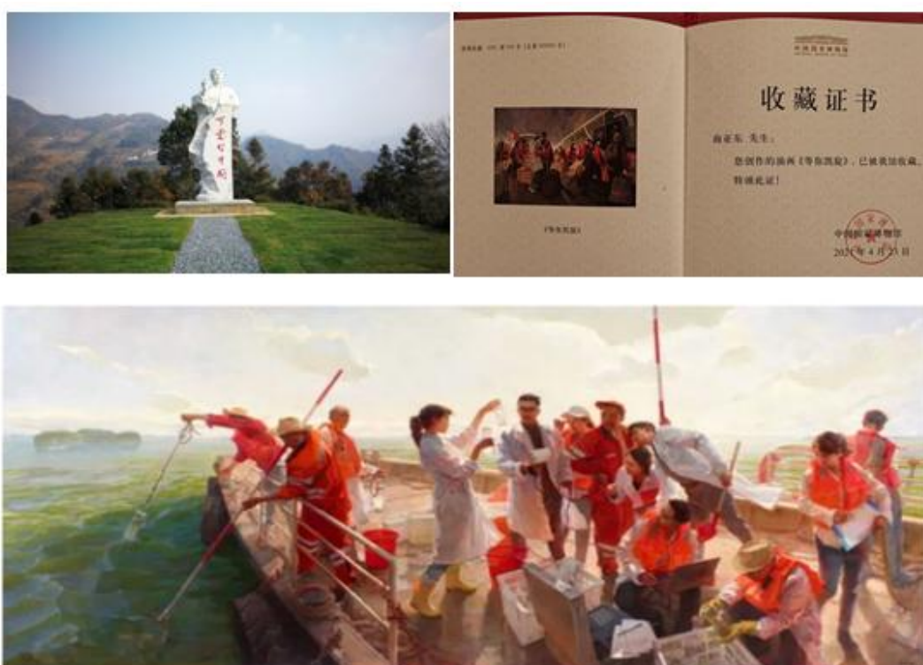
高亚东《最美太湖水》油画 布面油彩 2019年 230cm×500cm 中国美术馆藏

常认可，“这份作品创作得真好，特别是眼神，充满着父亲那种坚定的光芒，让我感受到了父亲那种对革命的执著、对党的忠诚。”教师作品《公私合营好》和《最美太湖水》入展中宣部庆祝中国共产党成立100周年美术作品展，并被中国美术馆收藏。以抗疫逆行为主题的《等你凯旋》入选全国“众志成城—抗疫主题美术作品展”，并被中国国家博物馆收藏。