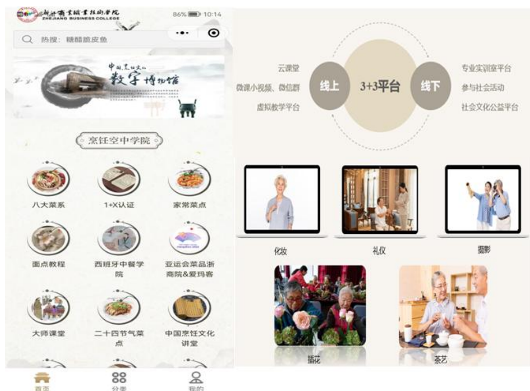
图 4：云端服务、智慧助老，服务未来社区建设

播等方式，让深度学习和沉浸式学习成为现实，满足银龄对生活美的追求。学校还组建了具备专业知识、技术技能、有意愿服务社区教育的师生团队，建设“养身烹饪云课堂”，成功入选教育部社区教育“能者为师”实践创新项目首批启动名单，助力“构建服务全民终身学习的教育体系”。