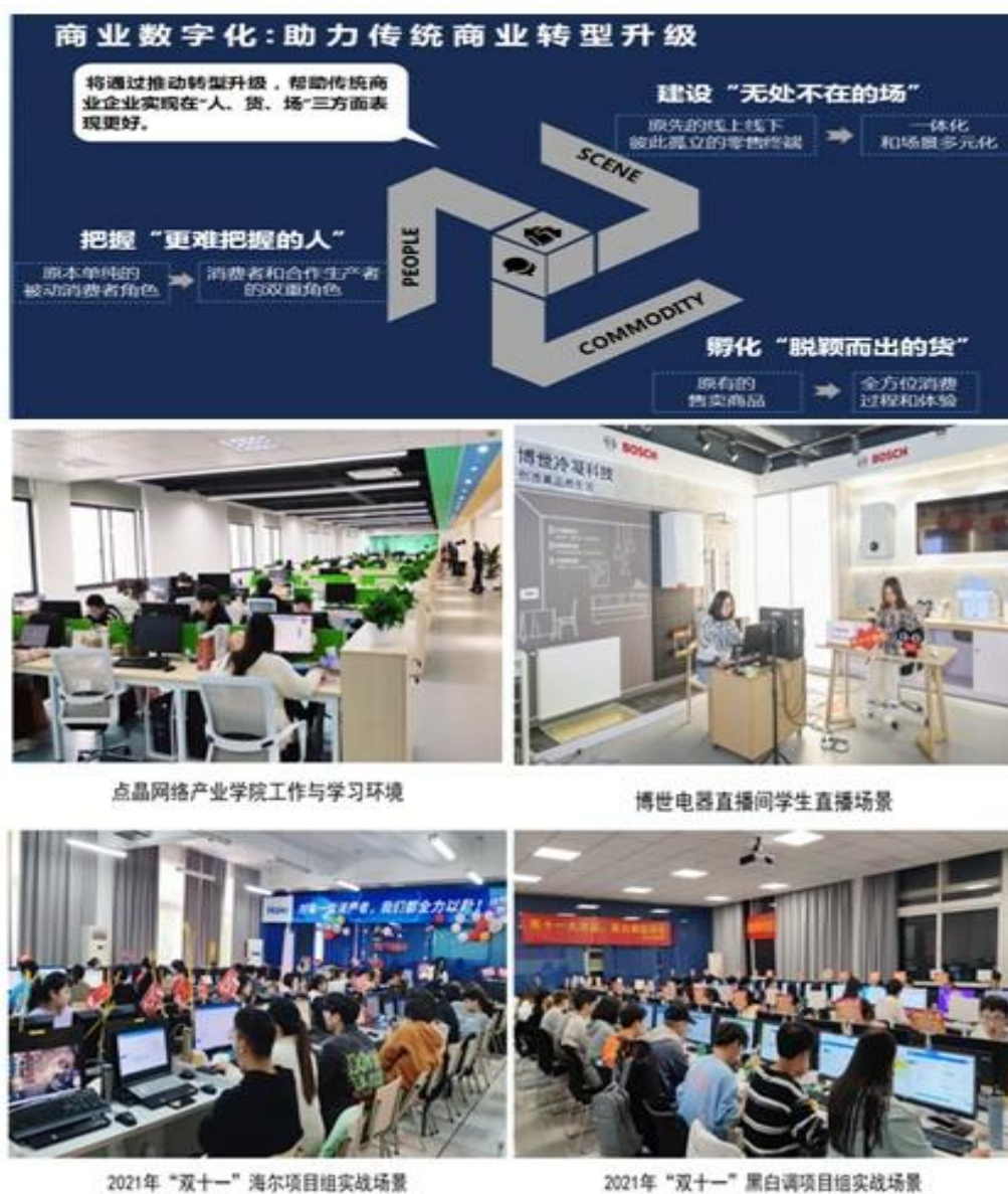
图1 学校、专业群、教师、学生“四级联动”助力企业数字化转型升级

品牌天猫旗舰店的运营，构成“数据驱动→感知体验→数据洞察→数据运营→数据追踪→数据汇集”的新商业模式闭环，实现企业在“人、货、场”三方面数字化转型。