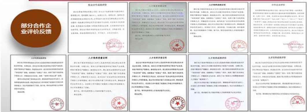
图 3：实施交换生项目，助推中西协作、山海协作，发力“扩中提低”